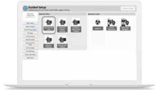
Connect PC yazılımı içinde kılavuzlu kurulum ekranı

Control Techniques'in Connect PC Yazılımı ile sürücünüzün tam kontrolünü elinize alın. Dinamik sürücü lojik şemaları, sürücünün gerçek zamanlı olarak görselleştirilmesini ve kontrol edilmesini sağlar. Parametre tarayıcısı, parametrelerin görüntülenmesini, düzenlenmesini, kaydedilmesini ve ayrıca parametre dosyalarının alınmasını sağlar.