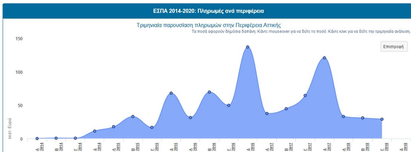
Εικόνα 9 - Διάγραμμα πληρωμών, ανάλυση περιφέρειας

Κάνοντας κλικ σε μια στήλη περιφέρειας, το διάγραμμα αλλάζει σε ανάλυση των πληρωμών για αυτή την περιφέρεια, ανά τρίμηνο. Ο χρήστης μπορεί να πατήσει το κουμπί «Επιστροφή» για να επιστρέψει στην προηγούμενη οθόνη.