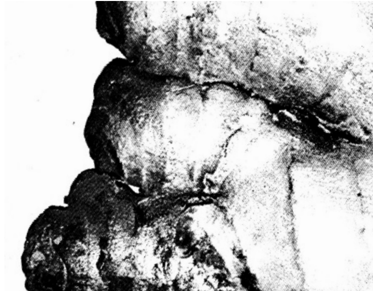
Bières/Vins +16 ans, Alcools forts/Spiritueux +18 ans