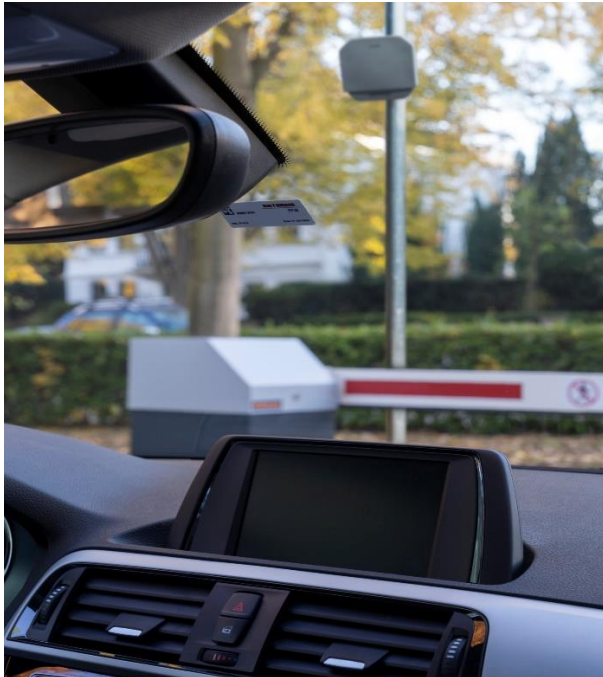
Bild 3: Ein RFID Weitbereichsleser kann einen RFID Windschutzscheibenaufkleber erfassen und bei Berechtigung die Ein- oder Ausfahrt freigeben.

Hörmann KG Verkaufsgesellschaft Tore · Türen · Zargen · Antriebe