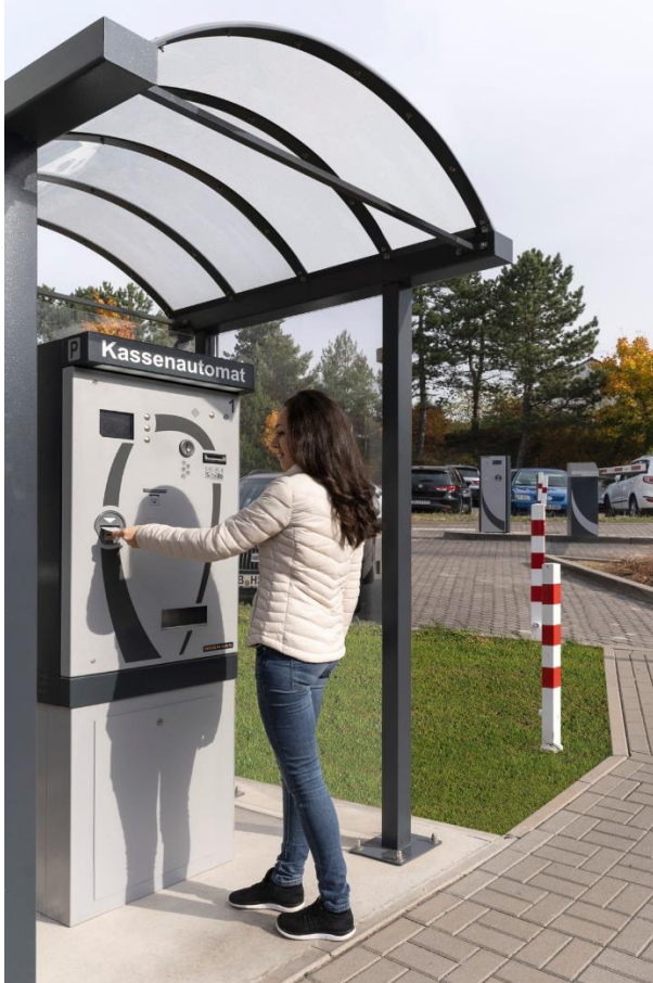
Bild 2: Kassensysteme können mit individuellen Bezahlssystemen (Bargeld, Kredit- und EC-Karten) betrieben werden.

Hörmann KG Verkaufsgesellschaft Tore · Türen · Zargen · Antriebe