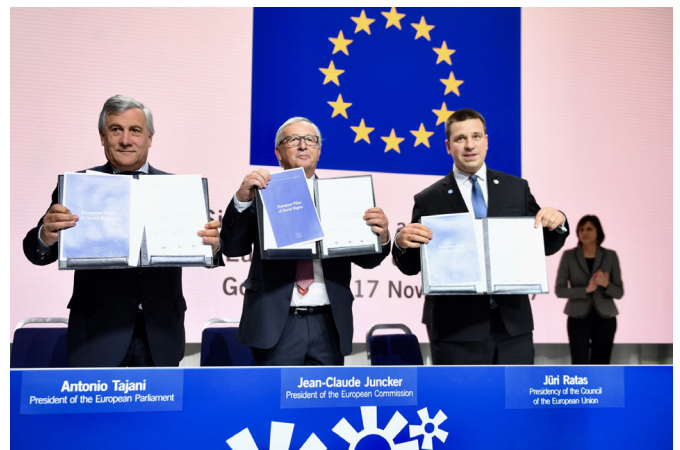
Cruinniú Mullaigh Sóisialta Göteborg do phoist chóra agus d'fhás, an 17 Samhain 2017

Léiriú air sin is ea Colún Eorpach na gCeart Sóisialta . Leagtar amach sa cholún sin prionsabail i ndáil le comhdheiseanna, rochtain chomhionann ar an margadh saothair, coinníollacha cothroma oibre, cosaint shóisialta stóinseach agus cuimsiú sóisialta láidir. Ag Cruinniú Mullaigh Sóisialta Göteborg i Samhain 2017, thug ceannairí an Aontais Eorpaigh gealltanas go neartóidís an ghné shóisialta den Aontas Eorpach, agus mar chuid de sin go gcuirfí Colún Eorpach na gCeart Sóisialta i bhfeidhm ina iomláine.