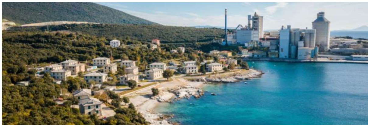
Slika 1

Projekt KOdeCO net zero , predstavlja jedini veliki projekt iz Hrvatske koji je odobren za sufinanciranje od strane EU Inovacijskog fonda. Vrijednost samog projekta iznosi 237 milijuna eura, od čega je 116,9 osigurano kroz Inovacijski fond. Realizacijom projekta 2028. sigurno će skladišti 3,67 milijuna tona CO 2 u periodu od 10 godina. Uz to, projekt predstavlja prvu ugljično neutralnu tvornicu cementa u Hrvatskoj, ali i na cijelom Mediteranu.