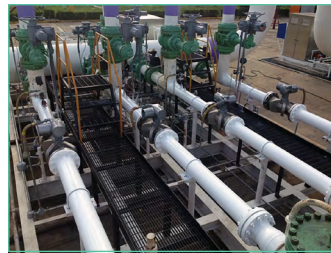
Sentinel LCT4 oder LCT8, 4- und 8-Pfad-Durchflussmesser für Flüssigkeiten für die oben genannten Anwendungen