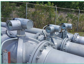
Sentinel LCT4 oder LCT8, 4- und 8-Pfad-Durchflussmesser für Flüssigkeiten für die oben genannten Anwendungen