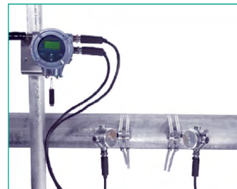
PanaFlowLC Flüssigkeits-Clamp-On-Durchflussmesser in 1, 2 Pfaden für die oben genannte Anwendungen