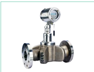
PanaFlow ZIG oder PanaFlow Z2G, 1- oder 2-Pfad-Durchflussmesser für Gase für die oben genannte Anwendung