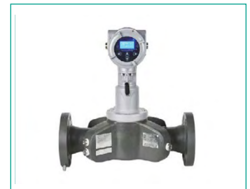
PanaFlow Z3 Inline-3-Pfad- oder 3-Durchflussmesser für die oben genannte Anwendungen