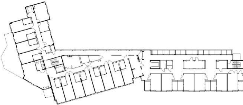
Plan du 2ème étage

Une réalisation entièrement vouée au service de femmes et d'hommes dans leur dernier trajet de vie. Une conception simple sans être simpliste, soignée et pleine de bon sens.