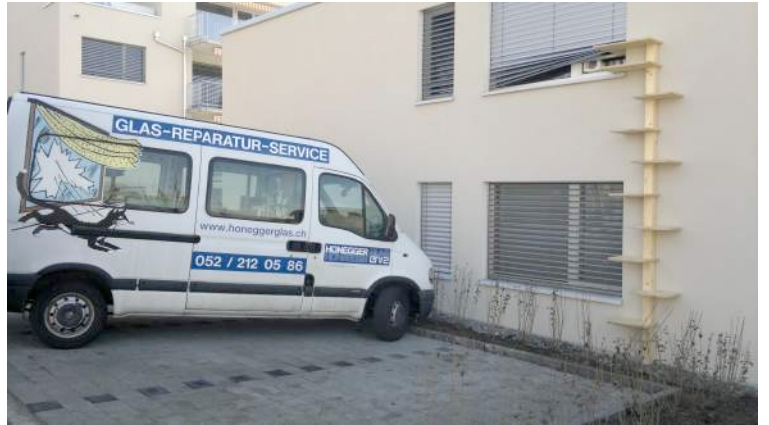
Für grosse Katzen oder kleine Hündchen Katzen - Leiter