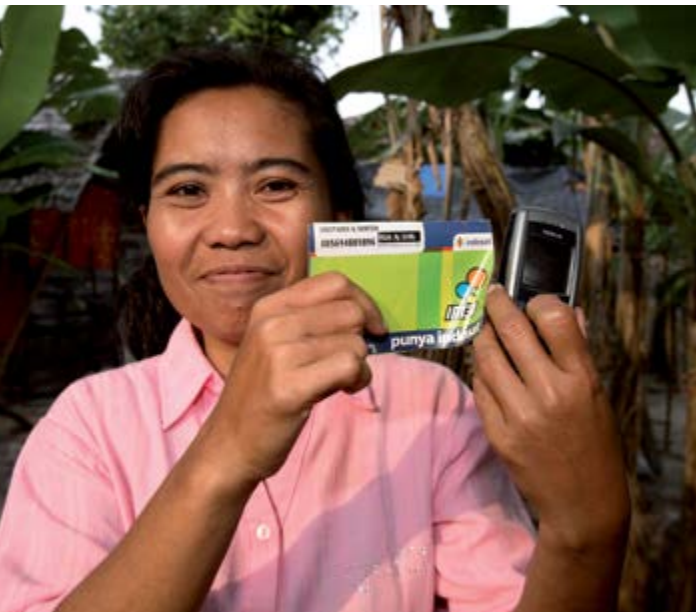
Distribution d'espèces via le mobile en Indonésie.

mortalité et de démarches extrêmes d'adaptation (liés à une consommation alimentaire inadéquate ou une piètre utilisation des aliments), seront revenus de façon stable au-dessous des seuils d'urgence, 18 ou laisseront prévoir une stabilisation au-dessous de ces seuils, indépendamment de l'aide humanitaire de la Commission. Il s'agit pour la majorité de la population affectée par la crise d'obtenir, pendant une période prolongée et pour l'avenir prévisible, des améliorations de la consommation alimentaire et de l'utilisation de la nourriture, sans recourir à des stratégies d'adaptation nuisibles.