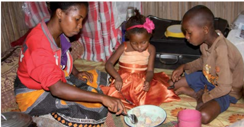
Madagascar – Une tubercule nouvellement introduite, qui peut résister aux inondations et être stockée durant la période de soudure, est très appréciée par les bénéficiaires.