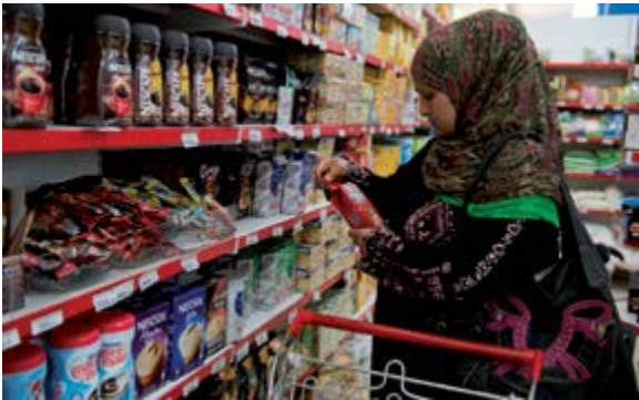
Utilisation de coupons alimentaires par des réfugiés syriens au Liban.