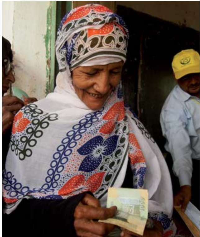
Yemen – Distribution d'espèces.

de la sécurité, de la protection et des implications de la corruption en rapport avec le transport, la manutention et la distribution de grandes quantités de liquidités et des compétences adéquates au sein des agences de mise en œuvre pour utiliser cette option relativement nouvelle. 51 De même, les risques (susceptibles d'affecter les marchés, la sécurité ou la protection) qui sont associés aux réponses alternatives telles que la distribution de denrées en nature doivent également être appréciés et envisagés attentivement.