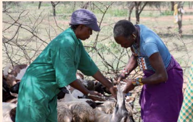
Kenya - Vaccination du bétail.

Tandis que les volets du programme ci-dessus ont été financés par l'assistance humanitaire de l'UE, un autre donateur a financé un programme complémentaire afin de soutenir la fourniture par le ministère de la santé de services de soins de santé préventifs et curatifs par le biais des installations sanitaires existantes et de la communauté.