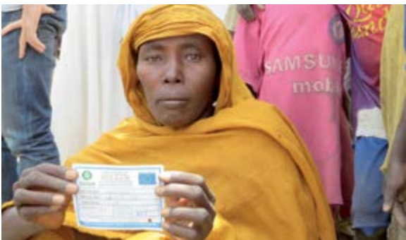
Sahel – Distribution de coupons.