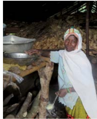
Bénéficiaire de l'assistance alimentaire en Côte-d'Ivoire.

10 % environ des personnes qui sont sous-alimentées connaissent l'insécurité alimentaire en conséquence d'une catastrophe ou d'une situation d'urgence et il faut s'attendre à ce que les besoins alimentaires qui en découlent sur le plan humanitaire et pour le développement continuent à augmenter. Il est donc essentiel que les ressources humanitaires disponibles soient utilisées de la façon la plus efficace et la plus efficiente en s'adaptant à cet environnement plus complexe et tendu, et que les décisions s'inspirent des meilleures pratiques, qui évoluent rapidement.