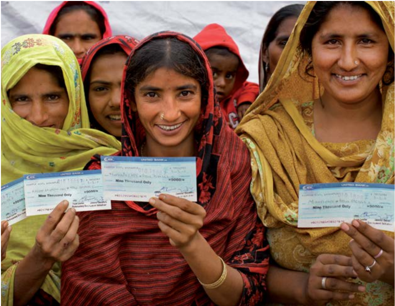
Distribution d'espèces aux femmes au Pakistan.

la plus appropriée sans nuire; et sur un examen serré des différentes sources de financement existantes.