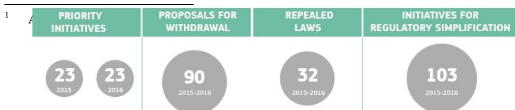
Grafika 1. Regolamentazzjoni aħjar f'ċifri matul l-2015–16

Kważi sentejn wara l-mandat tagħha, il-Kummissjoni qiegħda fit-triq it-tajba biex jintlaħqu l-impenji tagħna fuq ir-regolamentazzjoni aħjar. Mill-bidu, il-hidma tagħna kienet iggwidata minn sett iffukat ta' linji gwida politiċi 1 biex tidderiegi l-azzjoni fuq perjodu medju ta' żmien fuq l-isfidi ewlenin li tħabbat wiċċha magħhom l-UE: l-impjiegi, it-tkabbir u l-investment; il-migrazzjoni; is-sigurtà; id-diġitali; l-enerġija; jew l-approfondiment tas-suq uniku. Kull sena, miżuri konkreti li jirriflettu dawn l-istrategiji jiġu stabbiliti fi Programmi ta' Hidma ta' kull sena iffukati u effiċjenti. Kien hemm 100 inizjattiva fil-Programm ta' Hidma tal-2014. Fl-2015, il-Programm ta' Hidma kellu 23 inizjattiva u pakketti ġodda ta' prijorità. Kien hemm ukoll 23 biss fl-2016.