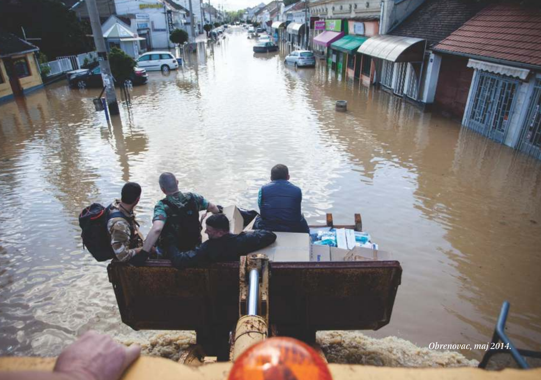
Obrenovac, maj 2014.