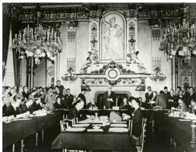
Ο Σουμάν εκφωνεί τον περίφημο λόγο του στις 9 Μαΐου 1950, που εορτάζεται πλέον ως η ημερομηνία γέννησης της ΕΕ.

Οι προσπάθειές του, όμως, δεν σταμάτησαν εκεί. Ήταν μέγας υπέρμαχος της περαιτέρω ολοκλήρωσης μέσω της δημιουργίας μιας Ευρωπαϊκής Αμυντικής Κοινότητας, ενώ το 1958 ανέλαβε πρώτος πρόεδρος του οργάνου που σήμερα είναι το Ευρωπαϊκό Κοινοβούλιο. Κατά την αποχώρησή του, το Κοινοβούλιο τού