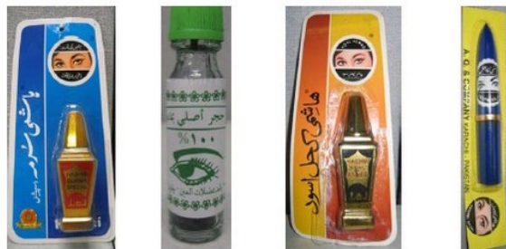
Hashmi Surma Special Pure Kohl from the Hashmi Kohl Aswad Hashmi Kajal

دا يوه دوديزه د سترگو د سينگار يو ډول دی په غير قانوني توگه امريکا ته له ډېرو هېوادونو څخه چې په آسيا، افريقا، او منځني ختيځ کې دي روارل کېږي. دا د ښځو، نارينوو، واره ماشومانو، ا د ځوانو ماشومانو په سترگو او پوستکي باندې وهل کېږي. دغه ځيني محصولات به لوړه درجه سرب لري چې کېدای شي ستاسو روغتيا لپاره ښه نه وي.