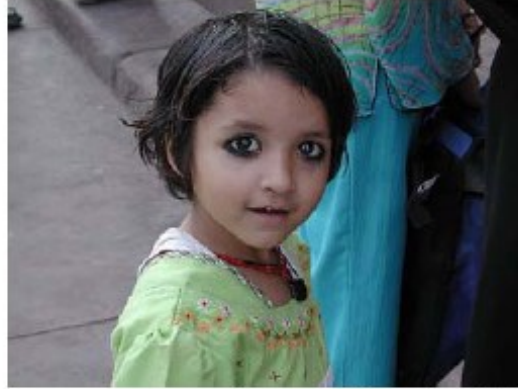
A young girl wearing kohl