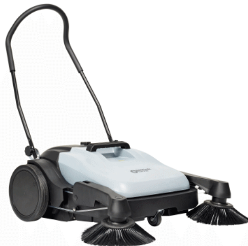
Zdjęcia produktów mają charakter poglądowy

Wszystko to sprawia, że ta szybka i wydajna zamiatarka Nilfisk nadaje się idealnie do utrzymania czystości w takich obiektach jak małe zakłady produkcyjne, parkingi, sklepy, szkoły, warsztaty, przystanki komunikacji miejskiej i tereny wokół obiektów biurowych.