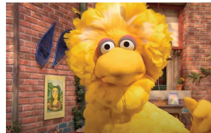
Здорово, что я такой!

Вместе с детьми сыграйте в игру «Рисуй, твори!» - она подарит вам радость творческого самовыражения.