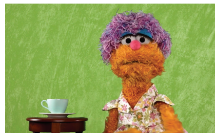
Минутка с Мэй: Все под контролем