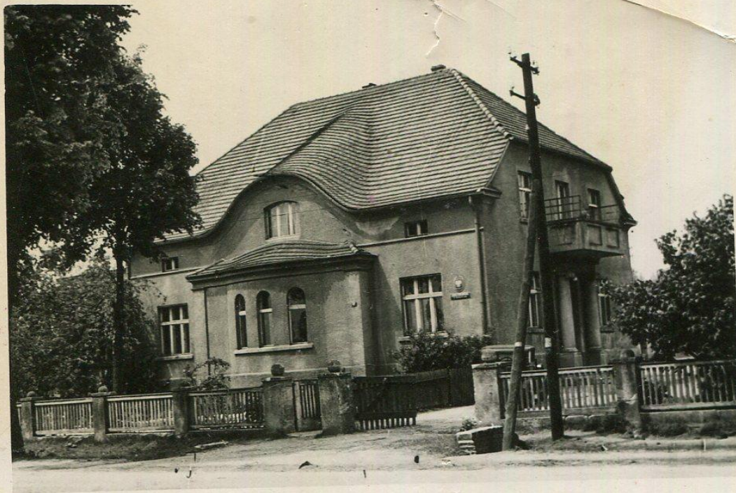
Szkoła podstawowa na Wieprzycach (stary budynek)