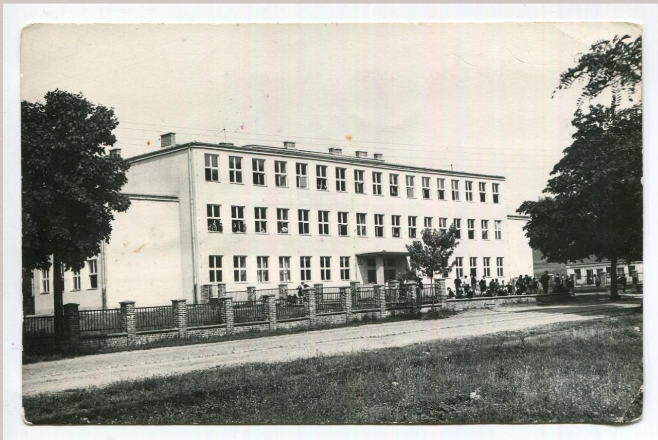
Nowy budynek Szkoły Podstawowej nr 12, Gorzów Wlkp.