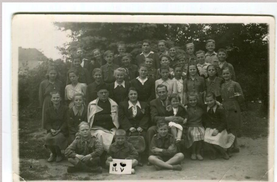
Szkoła Podstawowa na Wieprzycach, klasa V z nauczycielami, koniec lat 40.