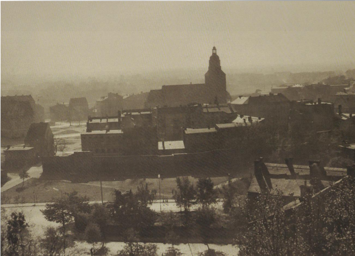
Panorama miasta Gorzowa Wlkp., kolekcja Gorzowskiego Towarzystwa Fotograficznego, lata 50. (aut. W. Kućko)

28 sierpnia 1945 roku opuściła Drohobycz i osiedliła się w Gorzowie Wlkp.