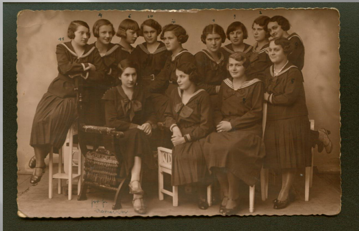
Uczennice Prywatnego Seminarium Nauczycielskiego, kurs IV, Drohobycz, 1933 r.