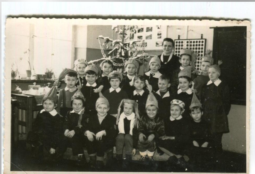
Szkoła Podstawowa nr 7, Gorzów Wlkp., r. szk. 1959/1960