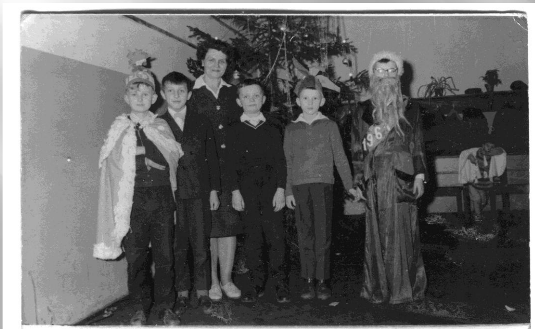
Szkoła Podstawowa nr 7, Gorzów Wlkp., r. szk. 1964/1965