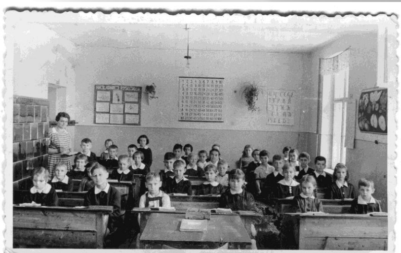
Szkoła Podstawowa nr 7, Gorzów Wlkp., r. szk. 1960/1965