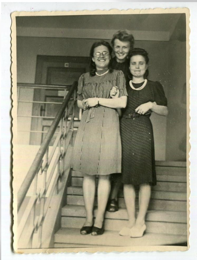
Zarząd Miejski, Gorzów Wlkp., 1947/1948 r.