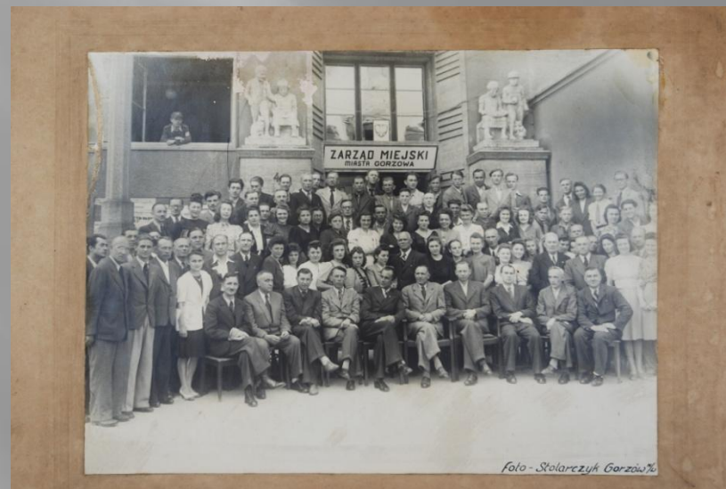
Zarząd Miejski, Gorzów Wlkp., 1945 r.