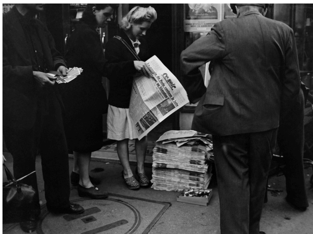
Août 1944 : des Parisiens se précipitent sur les journaux du jour qui viennent d'être livrés.