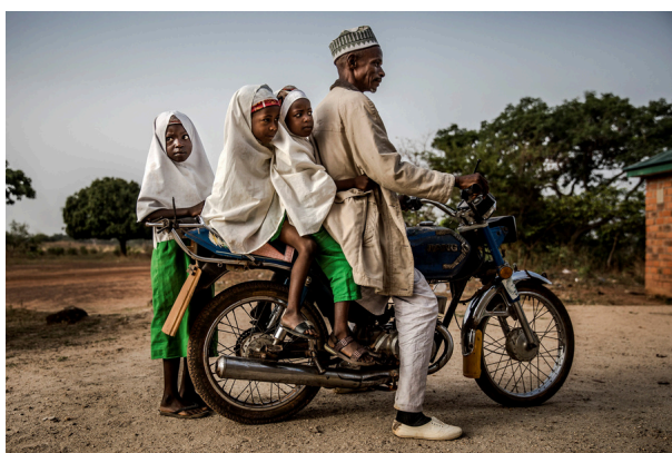
Des jeunes filles accompagnées par leur père à moto, arrivent à l'école nomade de Wuro Fulbe dans la réserve de pâturage de Kacha pour les Peuls, dans l'État de Kaduna, au Nigéria, le 19 avril 2019.