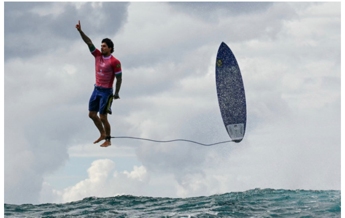
Le Brésilien Gabriel Medina réagit après avoir pris une grosse vague lors de la 5e manche de l'épreuve 3 de surf masculin, lors des Jeux Olympiques de Paris 2024, à Teahupo'o, sur l'île polynésienne de Tahiti, le 29 juillet 2024.