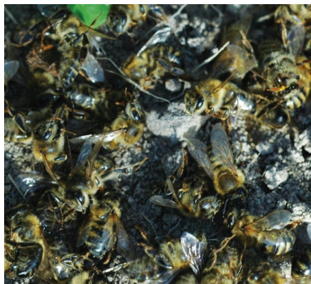
Martwe pszczoły przed ułem.