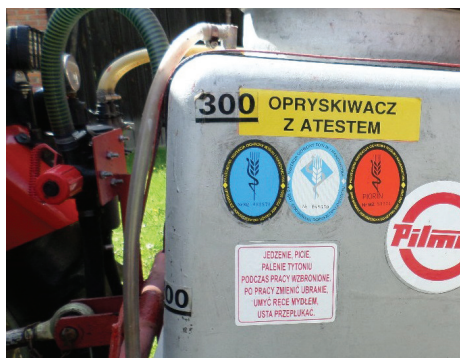
Znak kontrolny na opryskiwaczu potwierdzający jego sprawność techniczną.

W Polsce przestrzeganie zapisów zawartych w etykietach jest obowiązkowe (wyjątkiem są oczywiście podane w etykietach zalecenia np. zalecana dawka środka. W przypadku odstępstw od zaleceń np. zastosowania dawek zredukowanych lub łącznego stosowania agrochemikaliów, które nie są ujęte w etykietach, odpowiedzialność za skutki zabiegu spoczywa na stosującym).