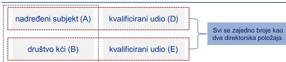
Brojanje višestrukih direktorskih položaja