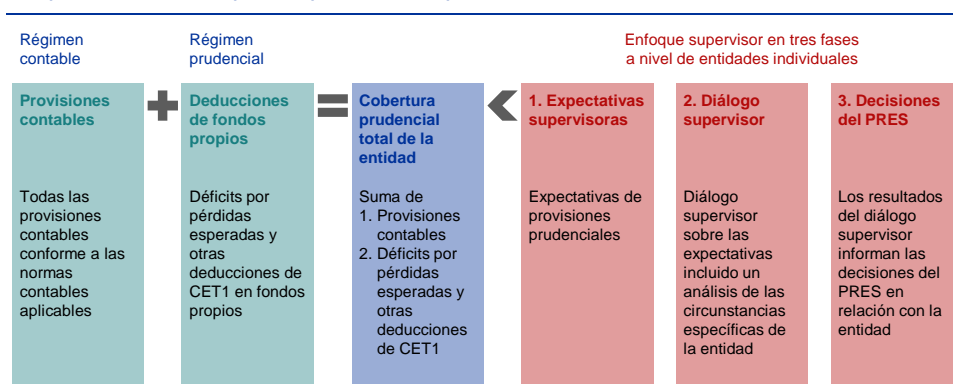
Figura 1 Esquema del concepto de provisiones prudentiales

Las expectativas prudentiales cuantitativas pueden ser más estrictas que las normas contables, pero no contradecirlas. Si el tratamiento contable no se considera