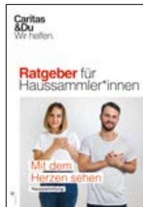
Ratgeber für Sammler*innen, A5 (21,5 x 15 cm)