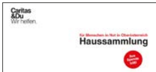
Kuvert, DIN C5/C6 (11,4 x 22,4 cm)