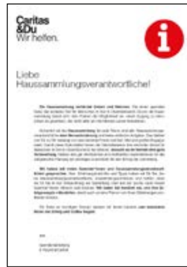
Heft Haussammlungsverantwortliche, A4