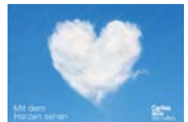
Danke-Karte für Spender*innen, A6 (10,5 x 15 cm) (Rückseite leer)