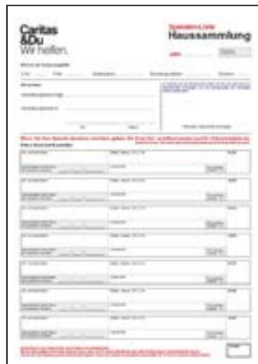
Spendenliste, A4, doppelseitig