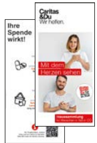
Folder für Spender*innen, DIN lang (10 x 21 cm) passt in Kuvert DIN C5/C6