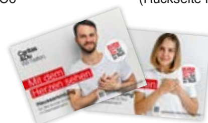
Plakate siehe Rückseite