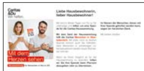
Liebe Hausbewohner*in, DIN lang (21 x 10 cm) passt in Kuvert DIN C5/C6