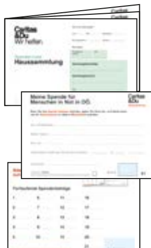
Spendenheft, A6, doppelseitig, 21 Spender*innen können einzeln eingetragen werden