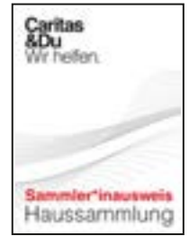
Sammelausweis, (10,5 x 7,5 cm)