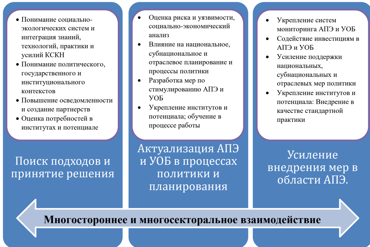
Рисунок 1. Пример структуры для включения мер в области адаптации к изменению климата и уменьшения опасности бедствий с позиций экосистем в планирование развития

Примечание: Адаптировано из: Всемирный фонд дикой природы (2013 год), Operational Framework for Ecosystem-based Adaptation: Implementing and Mainstreaming Ecosystem-based Adaptation Responses in the Greater Mekong Sub-Region; и ПРООН-ЮНЕП (2011), Mainstreaming Climate Change Adaptation into Development Planning: A Guide for Practitioners.