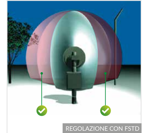
REGOLAZIONE CON FSTD

L'antenna parabolica per lunghe portate (sopra i 50 m) è più prestante in termini di purezza del segnale ricevuto, rispetto alle antenne planari o antenne ellittiche. In casi particolari, per esempio disturbi laterali continui, provocati da una rete metallica poco salda che tocca il fascio, vegetazione che sconfini nei bordi del lobo a microonde o grossi movimenti paralleli al fascio, è possibile sfruttare tramite abilitazione software l'FSTD (Fuzzy Side Target Discrimination). Esso rende meno sensibili o elimina totalmente i segnali provenienti dai bordi laterali del fascio a microonde e ottiene un fascio fisicamente cilindrico ma che in realtà risulta ellittico, mantenendo d'altronde i vantaggi di purezza del segnale ricevuto dall'antenna parabolica rispetto a quella ellittica.