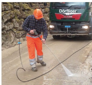
Wasser-Handlanze mit Hochdruck-Schlauch