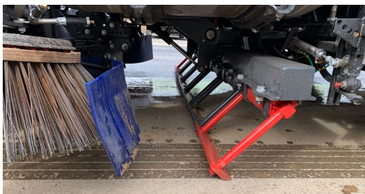
Kratzeinheit für festgefahrenen Dreck