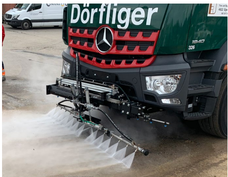
Hochdruck Frontwaschbalken, Breite bis 3.50 m