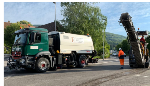
Fräsgutaufnahme / Flächenreinigung

REINHOLD DÖRFLIGER AG Trax- und Baggerbetrieb 4622 Egerkingen