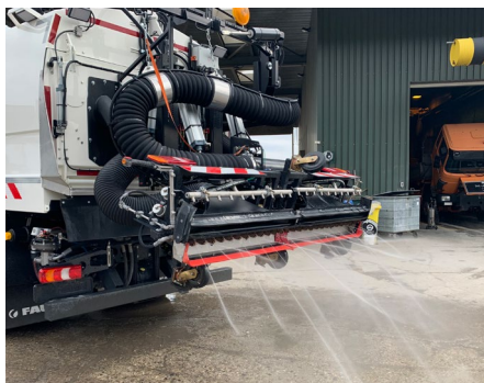
Rotationswaschbalken mit Flächenabsaugung (ganze Fahrzeugbreite)