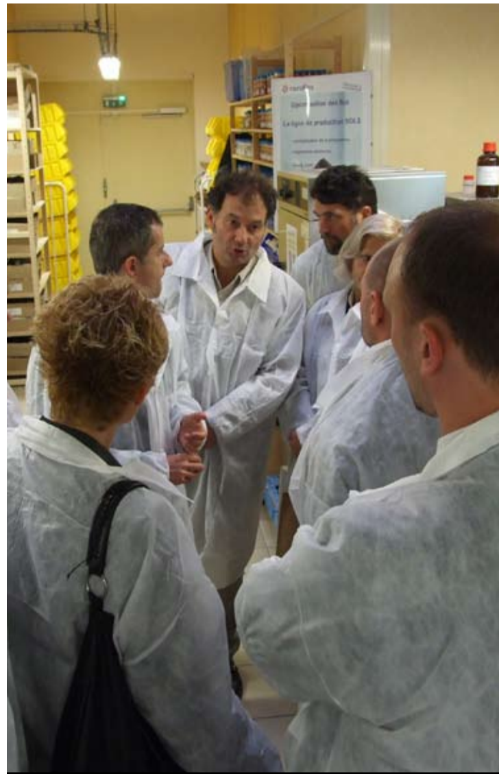
Wizyty mają większy wpływ na uczestników niż na wysyłające ich instytucje

nie miało pracy. Stopa bezrobocia wzrosła z 11,9 proc. w 2007 r. do 13 proc. w 2009 r. Według raportu, długi okres pozostawania bez pracy ma na młodych ludzi zły wpływ – gdy już dostaną etat, ich kariera rozwija się znacznie wolniej.