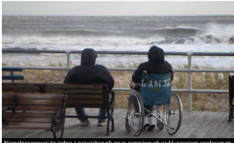
Niepełnosprawni to jedna z największych grup zagrożonych wykluczeniem społecznym

LEONARDO DA VINCI Niełatwo jest podsumować europejskie osiągnięcia w walce z ubóstwem i wykluczeniem w 2010 r. Nie ma zgody nawet co do podstawowych pojęć