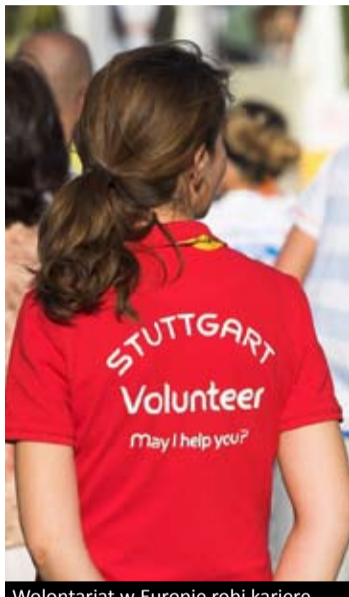
Wolontariat w Europie robi karierę

Dobrym przykładem programu, który pomaga kształtować kompetencje społeczne jest Wolontariat Europejski w ramach programu „Młódzież w działaniu”. Umożliwia on młodym ludziom bez doświadczenia i znajomości języka pracę w charakterze wolontariusza w zagranicznej organizacji pozarządowej.