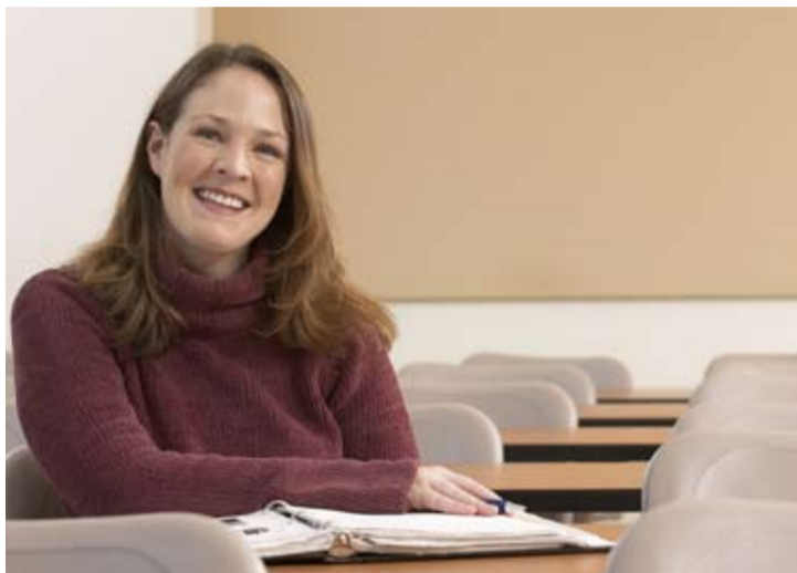
Dzięki Asystenturze Grundtviga można uatrakcyjnić ofertę edukacyjną dla seniorów

• Asystentury Grundtviga – dające możliwość asystowania we wspieraniu uczenia się osób dorosłych lub w wybranych aspektach zarządzania edukacją dorosłych przez okres od ponad 12 do aż 45 tygodni.