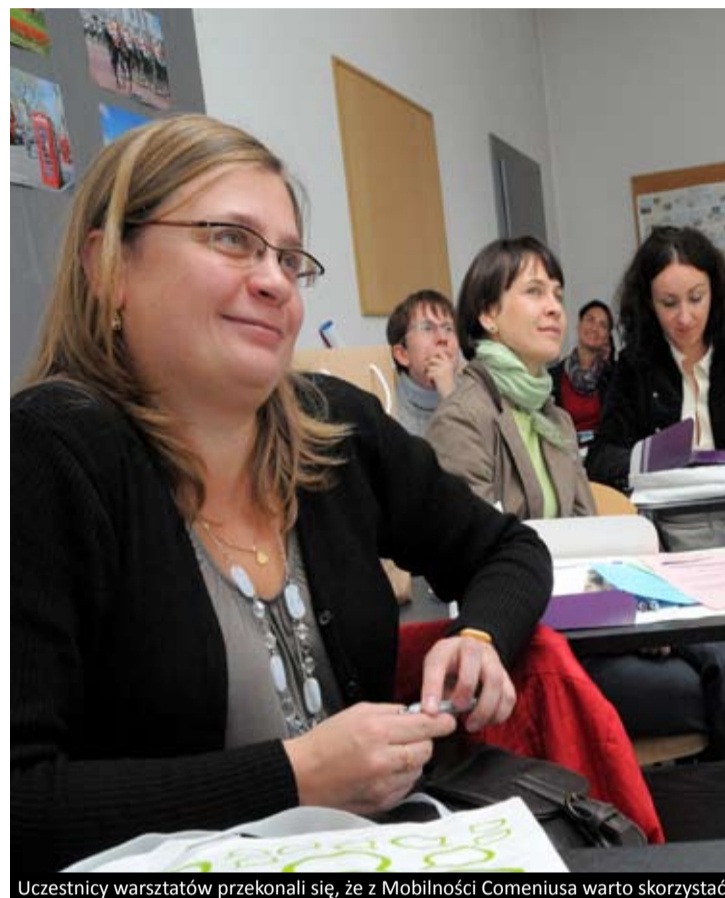
Uczestnicy warsztatów przekonali się, że z Mobilności Comeniusa warto skorzystać

Uczestników spotkania ucieszył fakt, że terminy składania wniosków są aż trzy – dzięki temu będą oni mogli wziąć udział w kursie w najdogodniejszym dla siebie czasie.