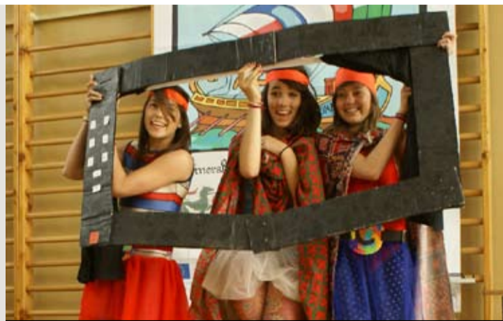
Uczestnicy warsztatów swoje umiejętności mogli sprawdzić pracując z uczniami

By robić to lepiej, wzięli udział w projekcie „Mówię, więc jestem”, zrealizowanym w Zespole Szkół nr 4 im. I.J. Paderewskiego w Pruszczu Gdańskim. W trakcie warsztatów mogli dowiedzieć się, jak mogą wspomagać swoich podopiecznych w rozwoju i jak mogą sprawić, by komunikacja na lekcjach, ale także po nich, poprawiła się. Poznali m.in. etapy rozwoju mowy u dzieci, zasady komunikacji zastępczej, tajniki mowy ciała oraz metod opanowywania stresu, zyskali też