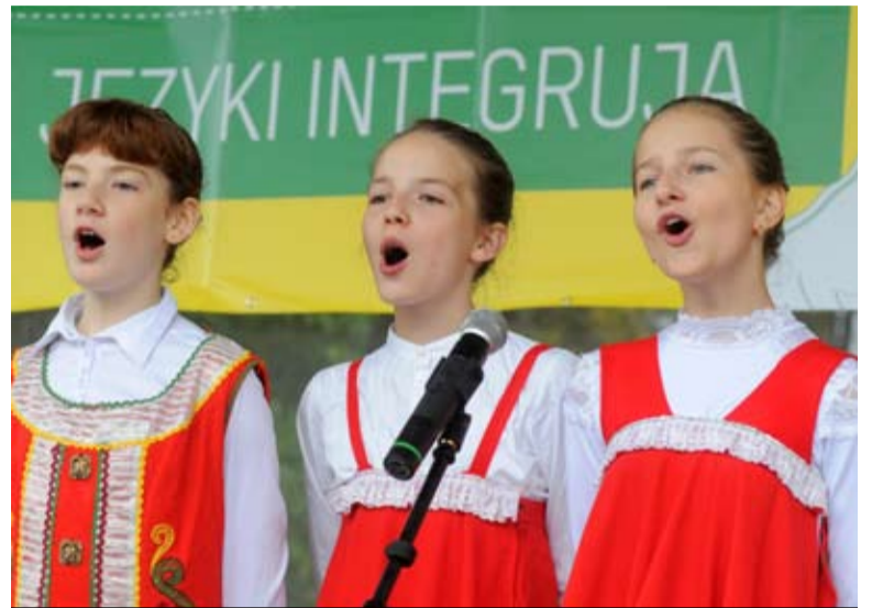
Wśród atrakcji Europejskiego Dnia Języków był m.in. występ rosyjskiego chóru dziecięcego

Specjaliści zwracali też uwagę na edukację językową osób dorosłych i star-