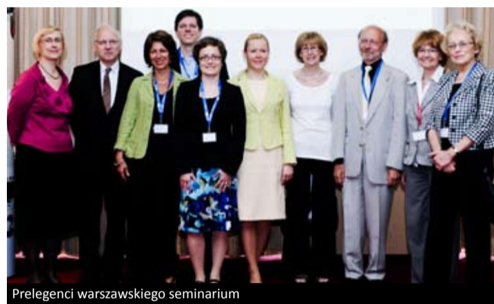
Prelegenci warszawskiego seminarium

ca. Według tej samej ankiety ponad 30% doktorantów w Europie nie spędza nawet jednej godziny tygodniowo na pisaniu doktoratu, a blisko 45% nie wie, jaką rolę pełni ich promotor czy opiekun naukowy. Dlatego też EURODOC reprezentuje pogląd, iż zarówno programy doktoranckie, jak i opieka promotorów nad doktorantami wymagają daleko idących zmian.