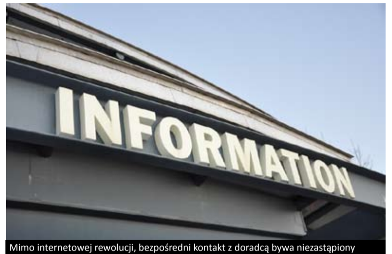
Mimo internetowej rewolucji, bezpośredni kontakt z doradcą bywa niezastąpiony

Przedstawianiem tych szans i możliwości zajmują się właśnie biura informacji mło-