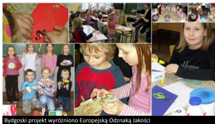
Bydgoski projekt wyróżniono Europejską Odznaką Jakości

cie”, mająca na celu zebranie rezultatów projektów partnerskich realizowanych w ramach programów sektorowych Comenius, Leonardo da Vinci oraz Grundtvig. W wyszukiwarce znaleźć można m.in. 422 Partnerskie Projekty Szkół.