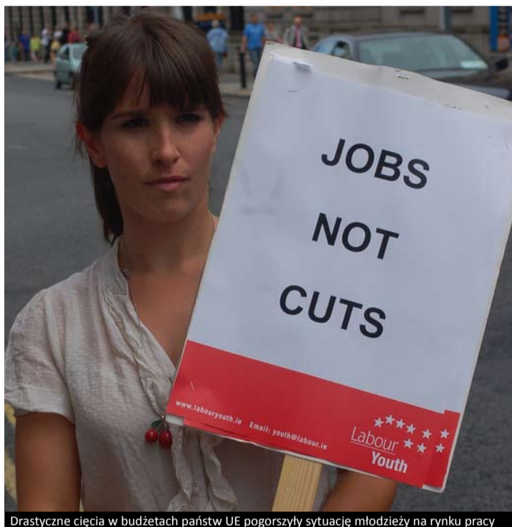
Drastyczne cięcia w budżetach państw UE pogorszyły sytuację młodzieży na rynku pracy

Wprowadzenie „Youth on the move” oznaczać będzie zmiany w istniejących programach związanych z młodzieżą. Nowa generacja inicjatyw, które zastąpią „Uczenie się przez całe życie”, „Młodzież w działaniu” oraz „Erasmus-Mundus”, ruszyć ma w 2014 r. Programy te