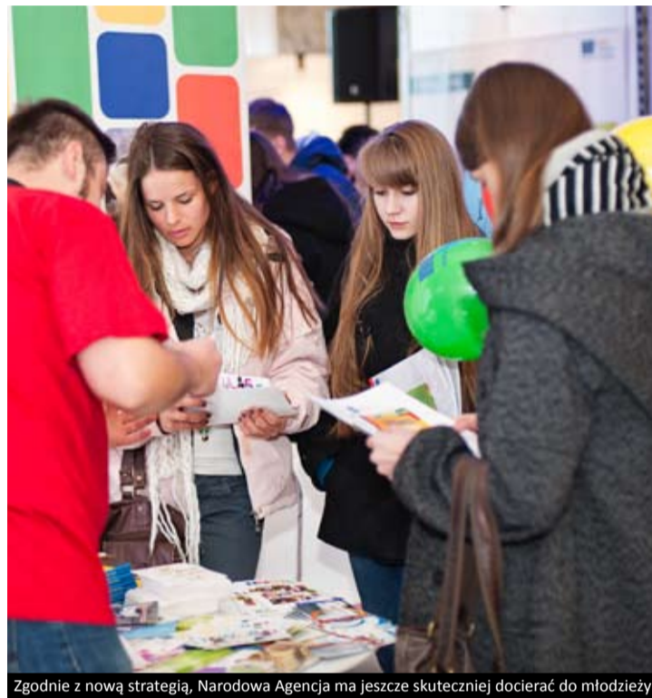
Zgodnie z nową strategią, Narodowa Agencja ma jeszcze skuteczniej docierać do młodzieży

Narodowa Agencja w internecie: ✉ www.mlodziez.org.pl