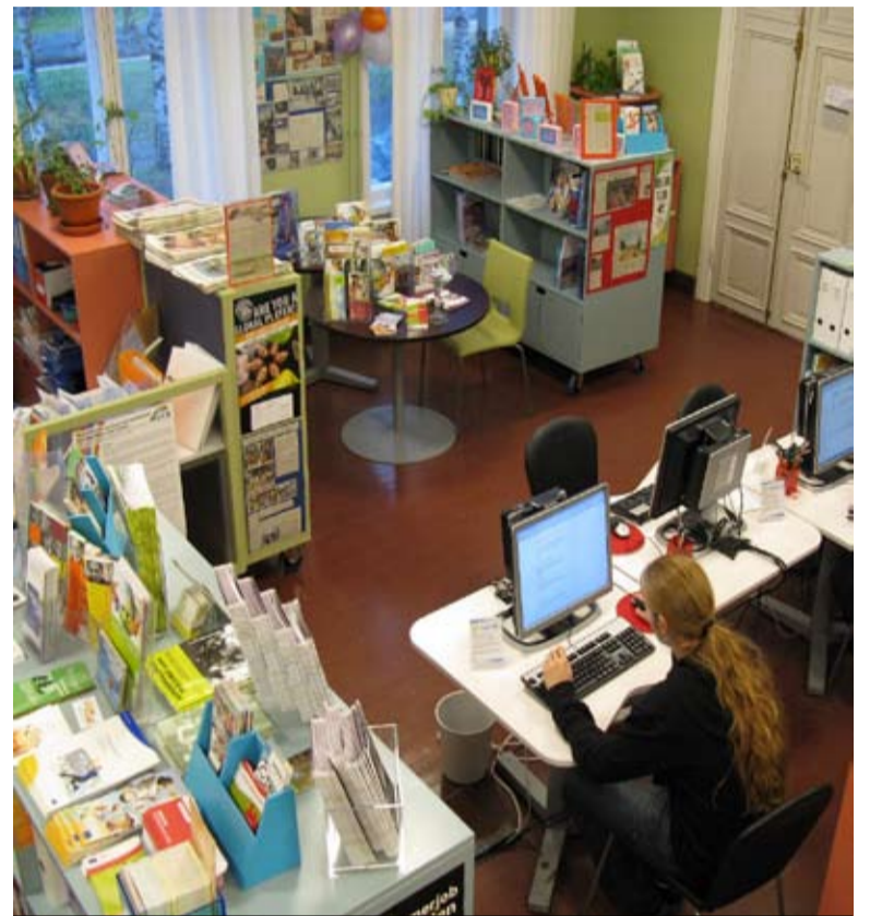
Centrum informacji młodzieżowej w Oulu – fiński spokój i porządek

W sumie dostęp do usług informacyjnych ma w Finlandii 87 proc. osób w wieku od 13. do 24. roku życia. Informacje trafiają do nich różnymi kanałami i z wykorzystaniem nowoczesnych metod. W tym słabo zaludnionym kraju działają aż 142 centra informacji i 36 internetowych serwisów.