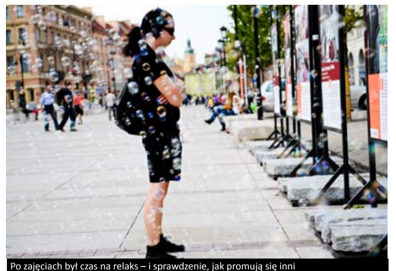
Po zajęciach był czas na relaks – i sprawdzenie, jak promują się inni