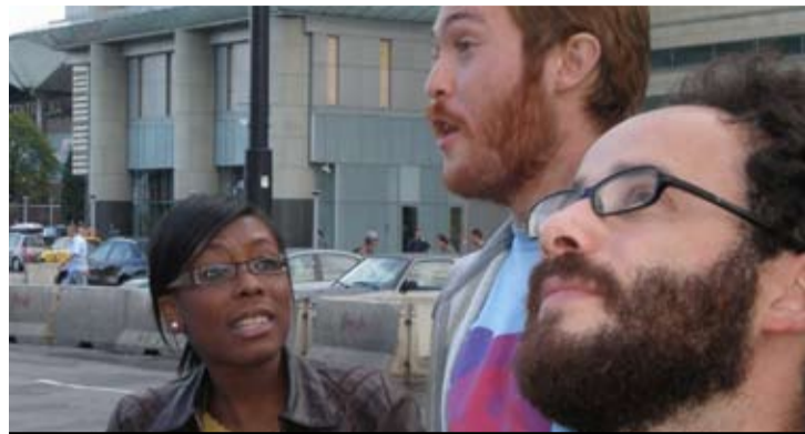
Wyjątkowe studia w wyjątkowych miejscach – oto oferta Erasmusa Mundusa

nych mogą opisać swoje doświadczenia w specjalnym formularzu dostępnym na stronie www.prime.esn.org/content/questionnaires . Opinie zbierane będą do końca kwietnia 2011 r. Projekt PRIME wspiera Komisja Europejska.