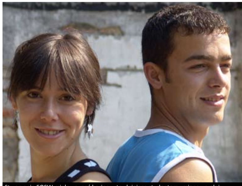
Stworzenie EOSW miało usunąć bariery utrudniające studentom zmianę uczelni

MOBILNOŚĆ STUDENTÓW W marcu mija pierwsza rocznica utworzenia Europejskiego Obszaru Szkolnictwa Wyższego. Politycy świętują – niestety, wydaje się, że przedwcześnie