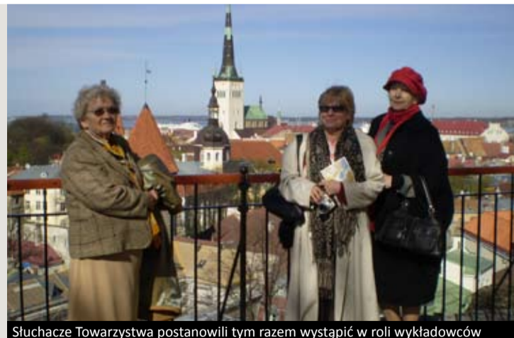
Słuchacze Towarzystwa postanowili tym razem wystąpić w roli wykładowców

Już wcześniej regularnie spotykali się, by słuchać wykładów z historii, sztuki, poświęconych współczesnym zagadnieniom społecznym, brali udział w imprezach muzycznych. Teraz postanowili, że to oni wystąpią w roli mentorów i wykładowców. W ramach projektu „MEMENTO – sztuka odbicia wspomnień i kultury” spisali swoje wspomnienia z lat 1939-89 i opublikowali je w dwóch wersjach (po polsku i po angielsku) na stronie internetowej, przygotowanej przez belgijskich specjalistów. Co kilka miesięcy członkowie grupy odwiedzali także zaprzyjane instytucje kulturalne i społeczne, by podzielić się swoimi doświadczeniami i zdobytą przez wiele lat wiedzą – byli m.in. w Anglii, Belgii, Hiszpanii i Estonii.