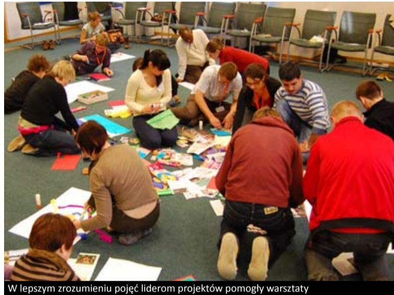
W lepszym zrozumieniu pojęć liderom projektów pomogły warsztaty

MŁODZIEŻ W DZIAŁANIU Lepsze rozumienie definicji pomoże w marketingu projektów – uznali uczestnicy spotkania liderów projektów młodzieżowych Akcji 1.