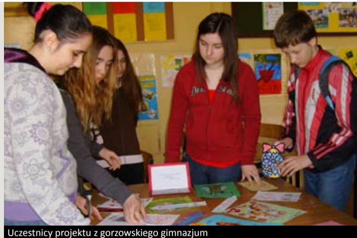
Uczestnicy projektu z gorzowskiego gimnazjum

Przede wszystkim umiejętne połączenie treści nauczania z różnymi przedmiotami. Uczestnicy projektu przedstawili słynnych astronomów ze swoich krajów (Kopernik, Galileusz), przygotowali prezentację na temat śladów pobytu Kopernika w Polsce i we Włoszech oraz poznawali Układ Słoneczny – obserwo-