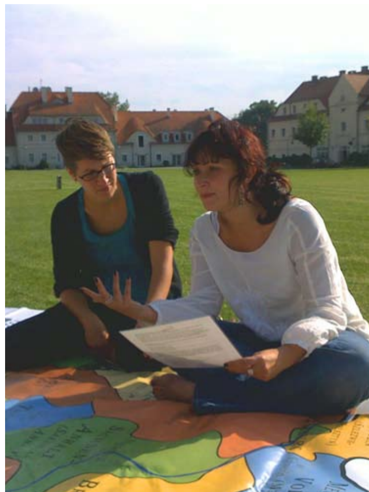
Uczestniczki szkolenia pracowników pedagogicznych na temat animacji językowej

ria oświaty, szkoły i ośrodki doskonalenia nauczycieli – zaproponowały inicjatywy związane m.in. z ewaluacją i kontrolą w szkołach, zastosowaniem ICT w edukacji i kształceniu zawodowym lub z podnoszeniem kluczowych kompetencji wśród uczniów. Ciekawie zapo-