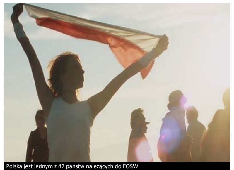
Polska jest jednym z 47 państw należących do EOSW

Mimo wciąż istniejących trudności, nie należy rezygnować z dążenia do realizacji ambitnego i korzystnego dla studentów