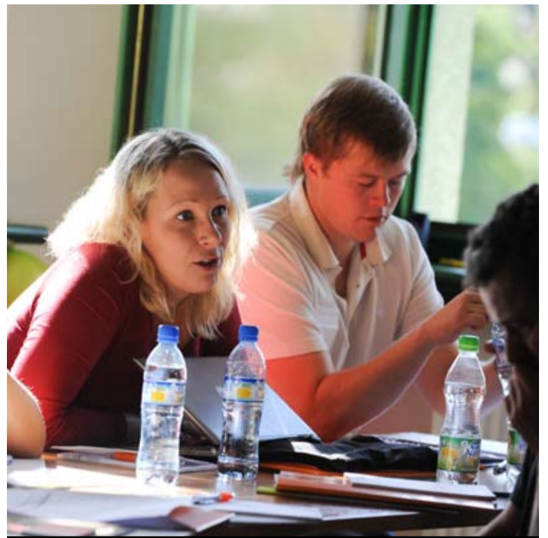
Błędy w komunikacji stanowią największy obszar ryzyka w projektach międzynarodowych