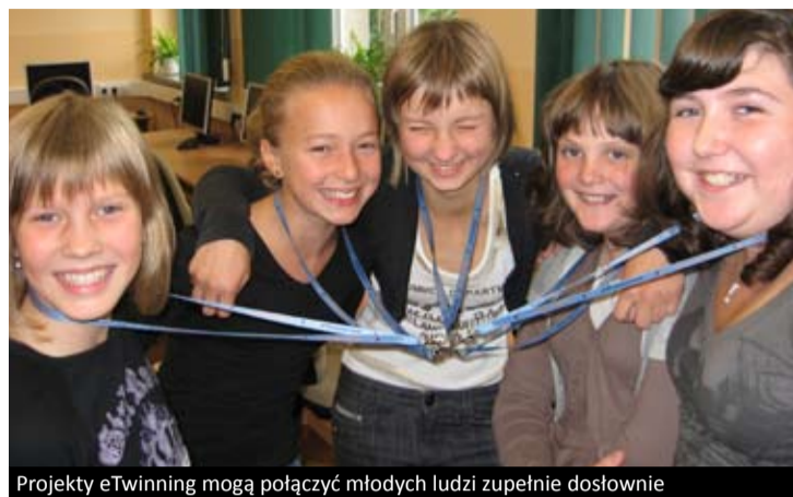
Projekty eTwinning mogą połączyć młodych ludzi zupełnie dosłownie

rysunkowy dla uczniów w wieku od 6 do 20 lat. Zwycięży ten autor, który najlepiej zilustruje, dlaczego lasy są tak ważne dla naszego świata. Termin przyjmowania prac upływa 30 czerwca 2011 r. Szczegóły na stronie www.fao.org .