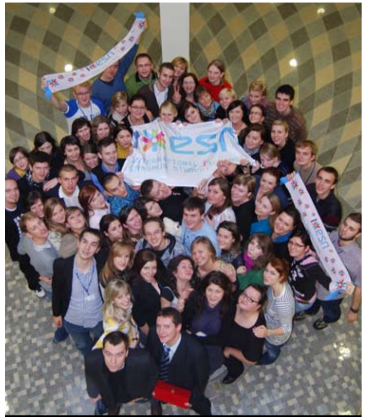
W najważniejszych miastach akademickich w Polsce działa 31 sekcji ESN

W procesie integracji studentów zagranicznych ze środowiskiem lokalnym pierwszy etap nawiązania relacji dzięki ESN następuje przez projekt Mentor. Każdy obcokrajowiec, który przybywa do Polski otrzymuje swojego opiekuna z ramienia tej organizacji. Pierwsze chwile w obcym kraju często są ogromnym przeżyciem, którego częścią stają się Polacy pomagający odnaleźć się w nowym środowisku. Najciekawszy w tym projekcie jest fakt, że nie ogranicza się on jedynie do doradźnej pomocy, ale często przeradza się w przyjaźń. To tak, jakby można było zamiast książek w bibliotece „wypożyczać” ludzi i uczyć się od nich o ich kulturze. Oczywiście – uczyć wszystkimi zmysłami i na wszystkich polach. To właśnie dzięki projektowi Mentor w ruinę obracają się wszystkie stereotypy dotyczące każdego kraju, a do głosu dochodzi wzajemna bliskość i prawdziwa wymiana kulturalna oraz integracja.