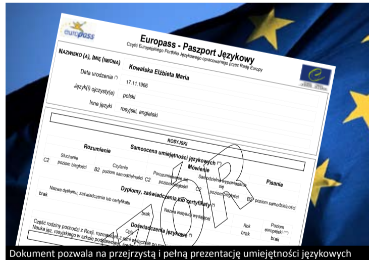
Dokument pozwala na przejrzystą i pełną prezentację umiejętności językowych

posiadać dokumentu, czyli etapów i form kształcenia oraz informacji na temat najważniejszych doświadczeń językowych i kulturowych związanych