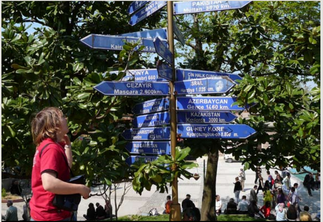
Dzięki projektom edukacyjnym Comeniusa nauczyciele mogą poznać nowe rozwiązania pedagogiczne

pracuje w Kuratorium Oświaty w Katowicach