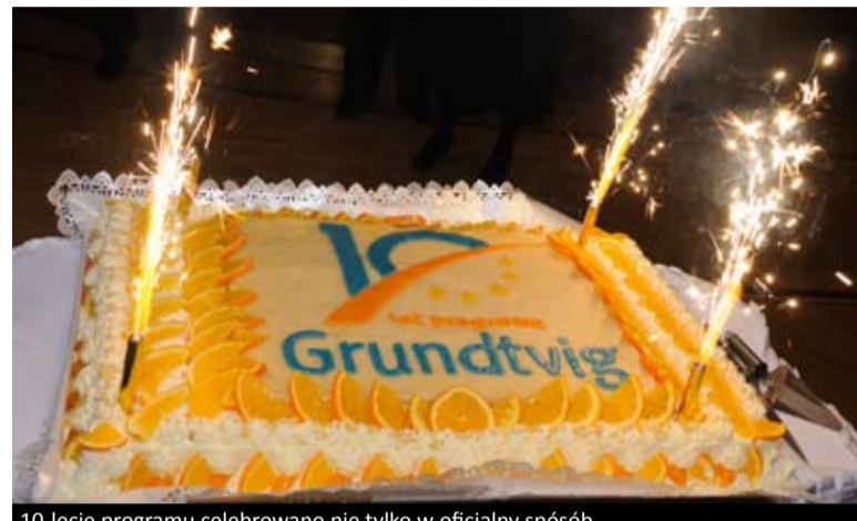
10-lecie programu celebrowano nie tylko w oficjalny sposób

GRUNDTVIG 10 lat temu złożono pierwsze wnioski w startującym wówczas programie. Dziś nikt nie ma wątpliwości, że w niezawodową edukację dorosłych warto inwestować