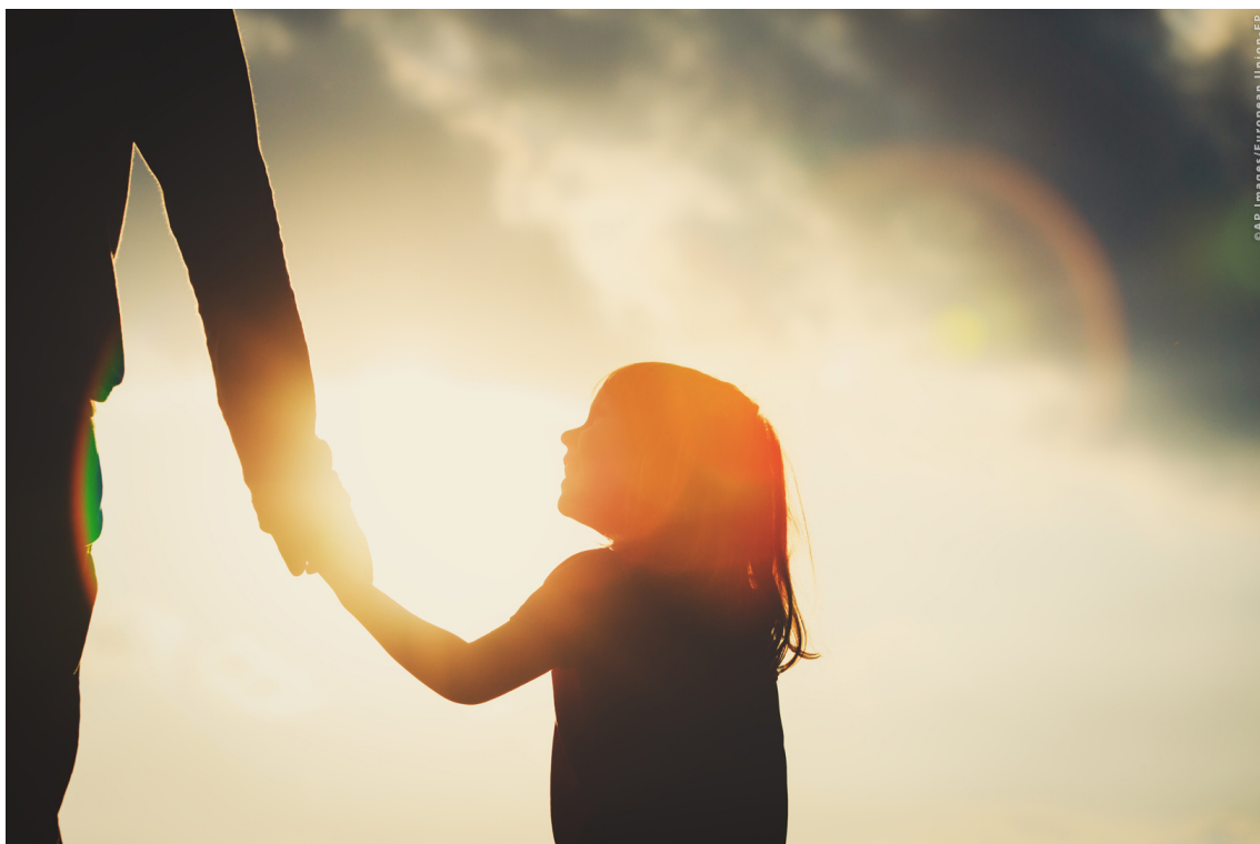
Pige og forælder

Fra barndom til pensionsalderen, de sociale politikker er vigtige i alle faser af livet. Find ud af her, hvilke EU-regler Parlamentet arbejder på.