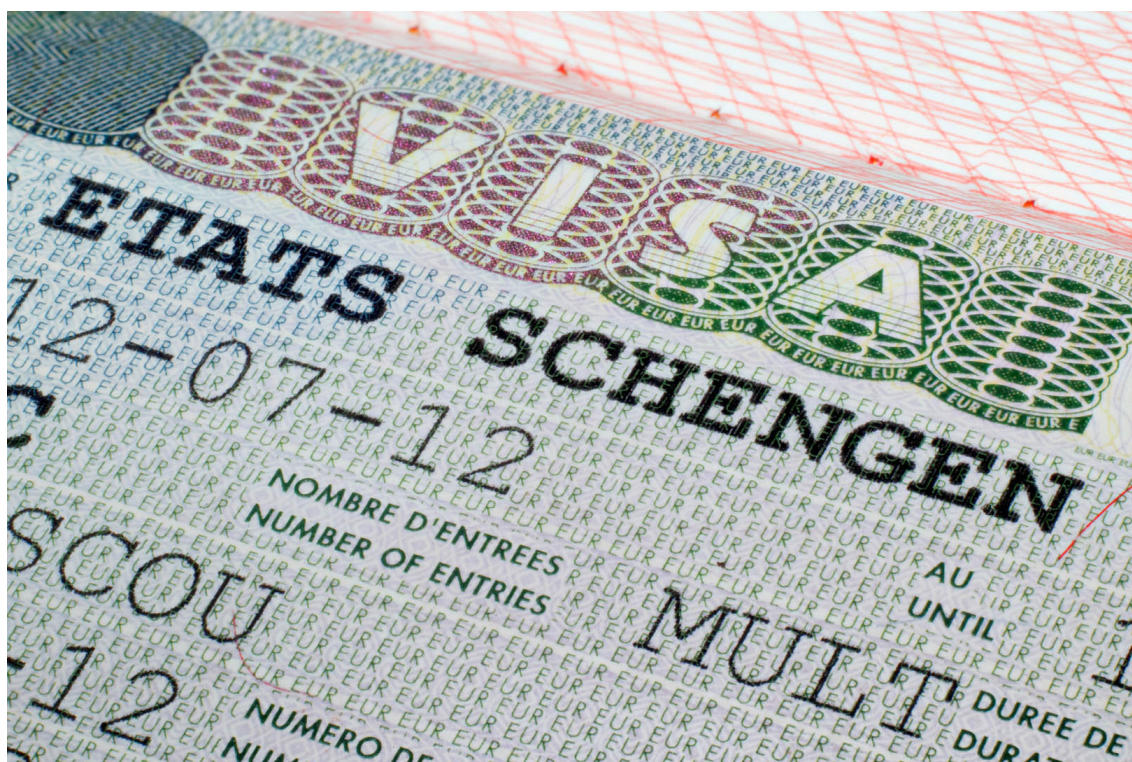
Visa i pas