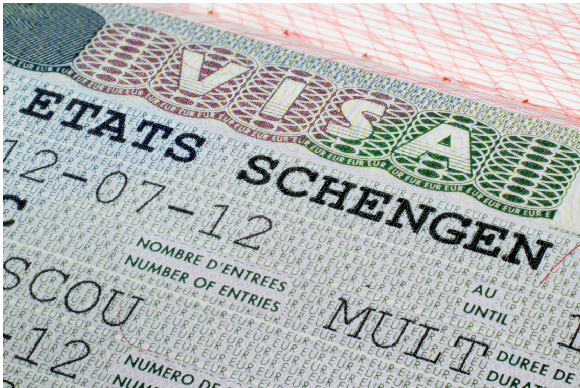
Schengenska viza u putovnici

Saznajte kako je Europol opremljen za borbu protiv kriminala i terorizma