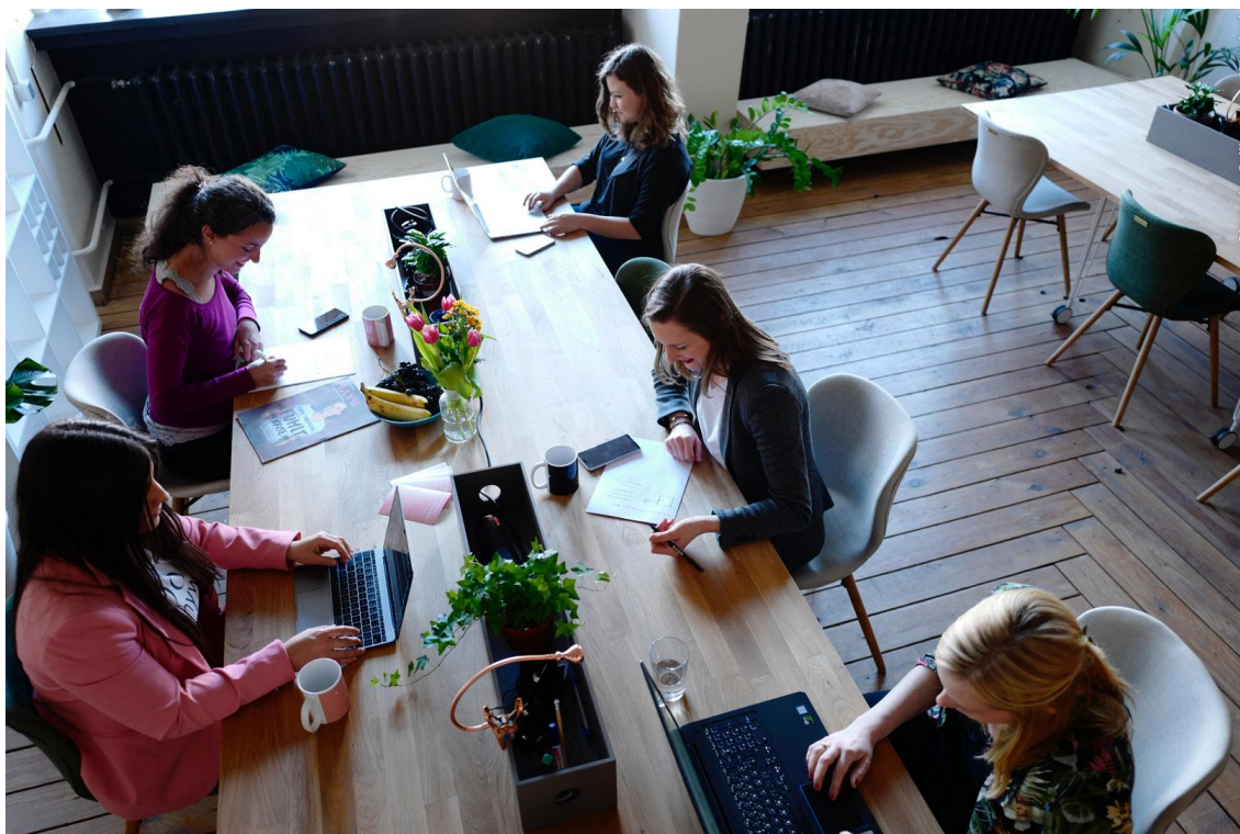
Nezaměstnanost mladých lidí je stálým problémem.

Nezaměstnanost mladých lidí je v Evropě stále závažným problémem. Přečtěte si, co pro řešení situace dělá EU.