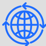
Boosting trade between EU countries