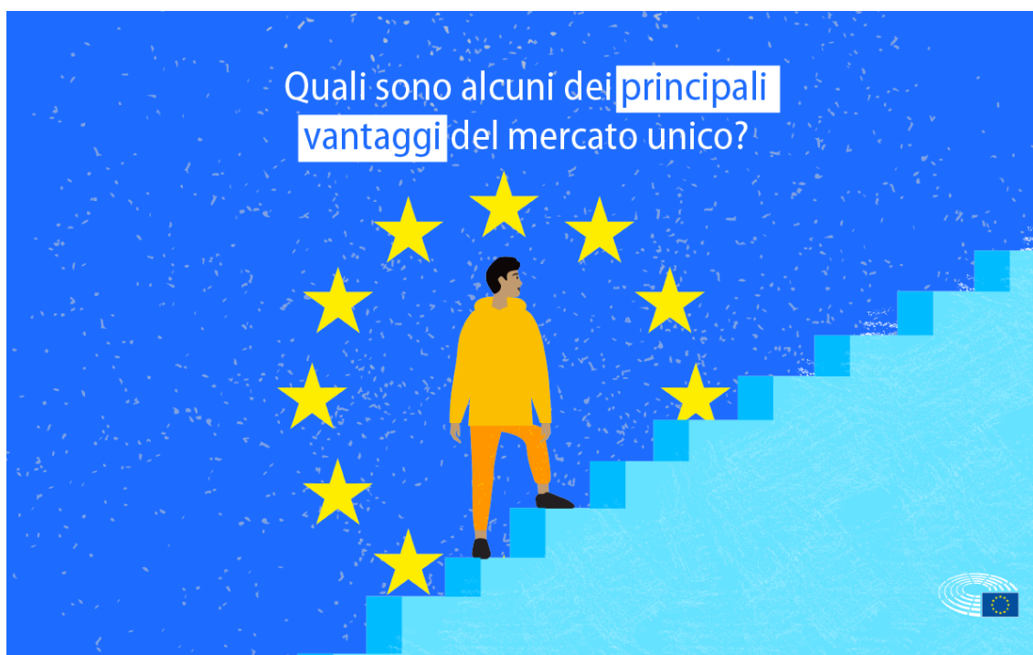
I principali vantaggi del mercato unico

I cittadini dell'UE beneficiano di elevati standard di sicurezza dei prodotti, possono studiare, vivere, lavorare e andare in pensione in qualsiasi paese dell'UE.