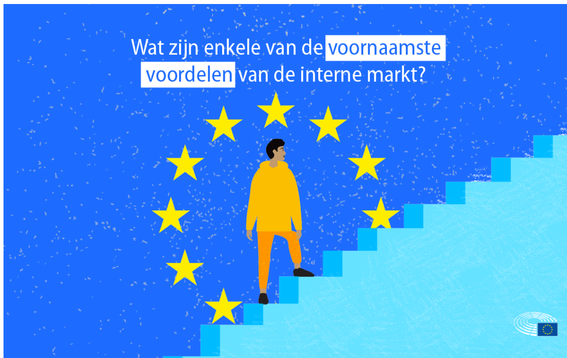
De voordelen van de interne markt

EU-burgers profiteren van hoge veiligheidsnormen voor producten en kunnen in elk EU-land studeren, wonen, werken en met pensioen gaan.