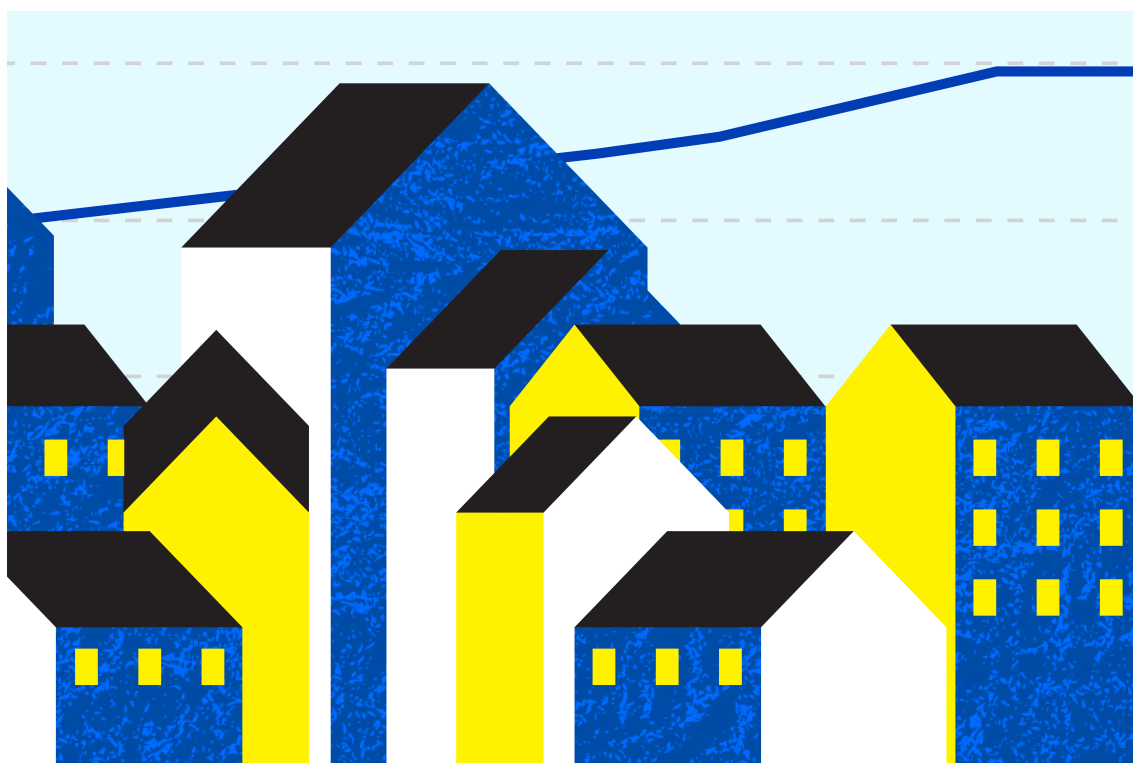
Növekvő lakhatási költségek az EU-ban

Az emelkedő lakásárak és bérleti díjak sok európai számára okoznak komoly fejtörést. Ismerje meg a legfontosabb tényeket és azt, hogy milyen lépéseket tesz az EU a témával kapcsolatban.