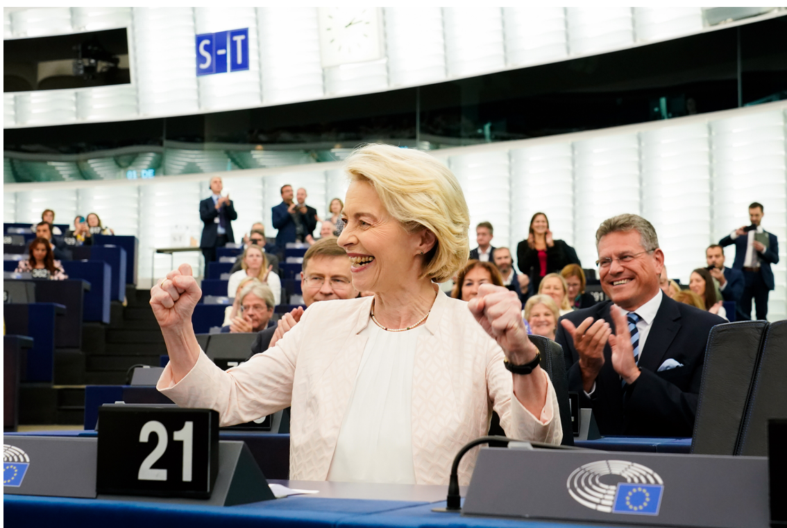
Ursula von der Leyen jatkaa Euroopan komission johdossa vuosina 2024-2029.