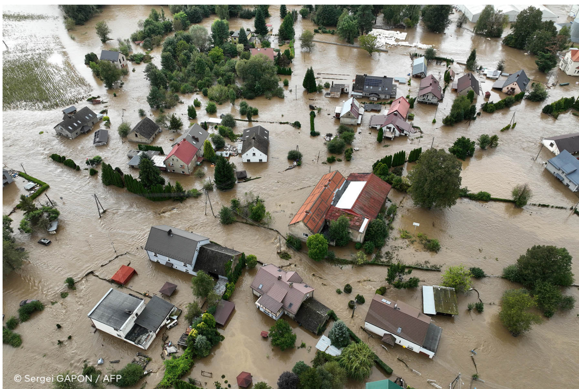
Niszczycielskie powodzie nawiedziły Europę Środkową i Wschodnią we wrześniu 2024 r.

Posłowie są głęboko zaniepokojeni rosnącą intensywnością i częstotliwością ekstremalnych zjawisk pogodowych w UE i na świecie, w tym powodzi na dużą skalę, fal upałów i pożarów.