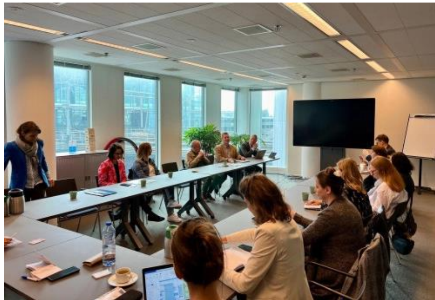
Spotkanie w Ministerstwie Edukacji, Kultury i Nauki w Hadze, 06.06.2024 r.