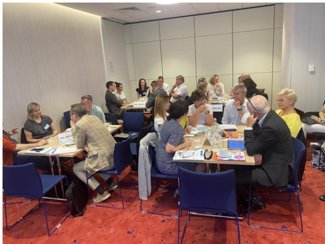
Spotkanie pre-konsultacyjne

Organizacja tematycznych sieci współpracy i wymiany doświadczeń w zakresie umiejętności