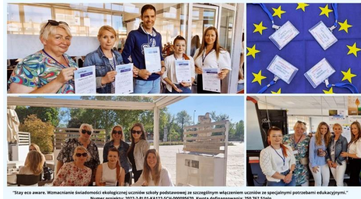
"Stay eco aware. Wzmacnianie świadomości ekologicznej uczniów szkoły podstawowej ze szczególnym włączeniem uczniów ze specjalnymi potrzebami edukacyjnymi." Numer projektu: 2022-2-PL01-KA122-SCH-000095670. Kwota dofinansowania: 250 762,51zł

CELE: podniesienie kompetencji językowych oraz z zakresu edukacji ekologicznej wśród uczniów i uczennic oraz przedstawicieli kadry pedagogicznej, kształtowanie postaw proekologicznych oraz solidarności i szacunku do uczniów ze specjalnymi potrzebami edukacyjnymi oraz budowanie odpowiedzialności za otaczające nas środowisko