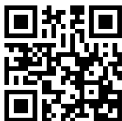
Interior 2.3 | Essential

Industriestrasse 38 CH-5314 Kleindöttingen T +41 (0)56 268 83 11 infoswiss@fundermax.biz www.fundermax.com