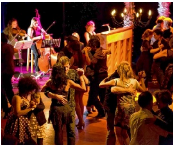
Organisé par la Compagnie Choc Trio, la première édition du Festival « Lusignan de la Plata » a connu un franc succès.

C'est ainsi que la population locale, se sentant concernée par cet événement, a été fortement représentée et découvert la Planète Tango, tant danseurs qu'aficionados venus des quatre coins de France - Poitou-Charentes, mais aussi Aquitaine, Centre, Midi-Pyrénées, Limousin, Bourgogne, Pays de Loire, Île de France -