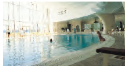
Thermes Marins Monte-Carlo 2 Avenue de Monte-Carlo / Monaco Tél. +377 98 086 69 00

顾客竞赛水疗中心，完全根据客户的票第五版看到Les Thermes酒店Marins蒙特卡罗加冕竞争激烈的最佳水疗奖在沙龙蒙迪艾尔水疗中心及BEAUTE的重创哈雷de la Villette公园在巴黎，3月中旬举行。纵观本次比赛水疗面对城市和水疗酒店经营者参加为他们的客户通过满意度调查问卷1月15日和2013年2月28日之间接受治疗的所有客户端完成。