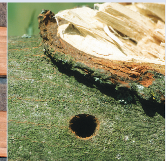
11. Kreisrundes Ausbohrloch

Befallssymptome sind an jungen Bäumen verhältnismäßig gut aufzuspüren. Bei Altbäumen mit dichtem Laub gibt letztlich nur die Inspektion in der Krone selbst, z. B. bei Baumpflegearbeiten, eine ausreichende Sicherheit. Selbst äußerlich vital erscheinende Bäume können Larven oder fertig entwickelte, schlupfbereite Käfer beherbergen.