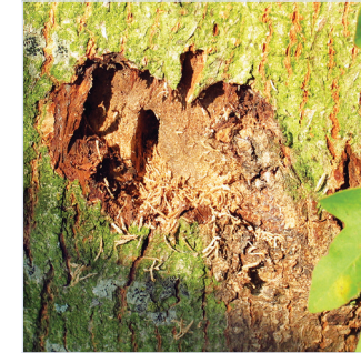
8. Larvenfraß unter der Rinde mit ovalem Einbohrloch der Larve