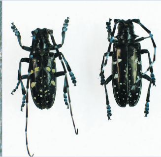
4. Erwachsene ALB, links Männchen, rechts Weibchen