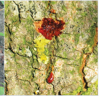
7. Eiablagestelle mit Safffluss