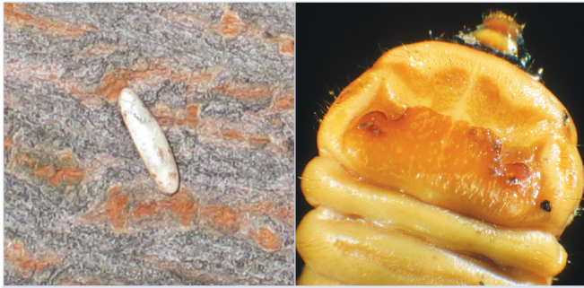
1. Reiskorngroßes Ei (7-8 mm)