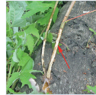
6. Reifungsfraß der Käfer an Ästen

Ausbohrlöcher: charakteristisch kreisrund, Durchmesser 1 - 1,5 cm (11).