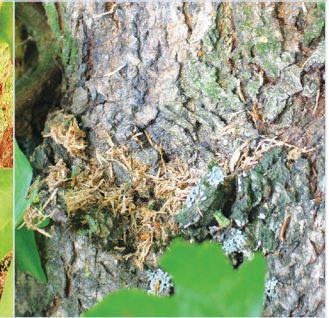
9. Von Larve ausgeworfene grobe Nagespäne