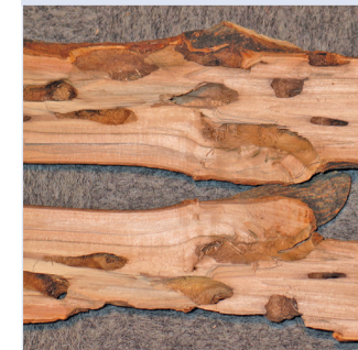
10. Breite Fraßgänge des ALB im Holzkörper