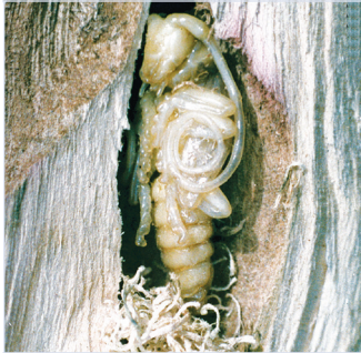
3. Puppe mit grobem Spanpolster in Puppenwiege