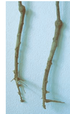
Wurzelfraß der Engerlinge

Eine Massenvermehrung des Waldmaikäfers führt zu Kahlfraß an Laubbäumen, auf den vitale Bäume mit einem Regenerationstrieb reagieren, ohne nachhaltig geschädigt zu werden. Die Kombination mit weiteren Stressfaktoren (z. B. Trockenheit) kann jedoch die Anfälligkeit für den Befall durch andere Forstschädlinge erhöhen. Wesentlich problematischer ist der Wurzelfraß der Engerlinge im Boden. Während der Fraß des ersten Larvenstadiums gering ist, verursachen die Engerlinge im 2. und 3. Stadium große Schäden an den Wurzeln. Dabei werden die Feinwurzeln vollständig und zudem die Rinde stärkerer Wurzeln befallen, so dass Wasser und Nährstoffe nicht mehr aufgenommen bzw. weitergeleitet werden können. Welke und Absterben junger Laubbäume in Kulturen und Verjüngungen sind die Folge. Auch ältere Bestände werden in der Vitalität geschwächt.