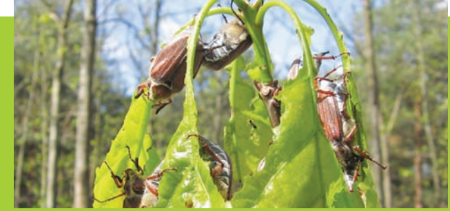
Reifungsfraß adulter Waldmaikäfer