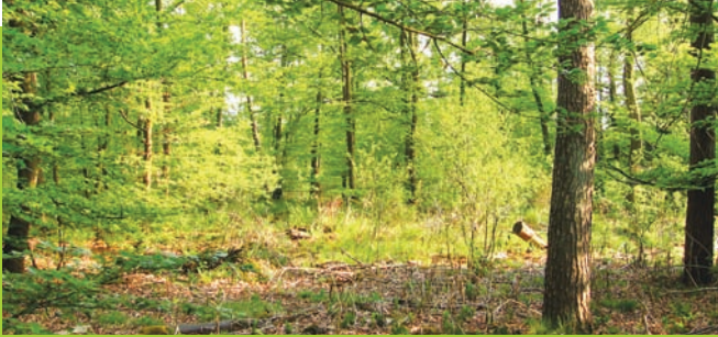
Habitat des Waldmaikäfers