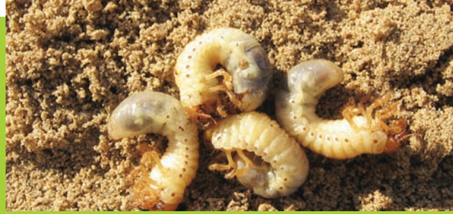
Engerlinge (3. Larvenstadium)