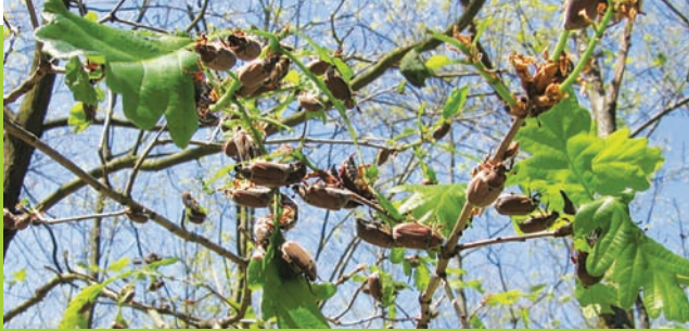
Vorliebe der Waldmaikäfer für Eichen