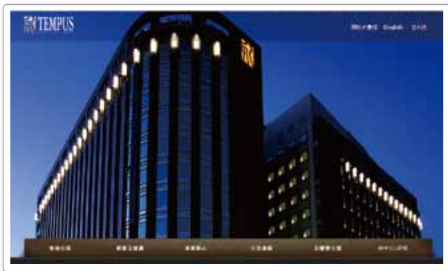
▲ 永豐棧酒店官方網站

永豐棧對於追求極致服務的執著，不僅顯現於現場服務團隊的熱忱與活力，面對訂席或訂房的顧客，行前對於各項事務的溝通與確認，也絲毫不敢怠懈，總是期望竭盡所能滿足顧客的一切需求。在此情況下，賴以傳遞訊息的電子郵件，自然成為該公司展現客服品質的重要途徑之一。