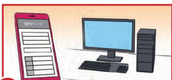
B オンラインやメール送信での提供