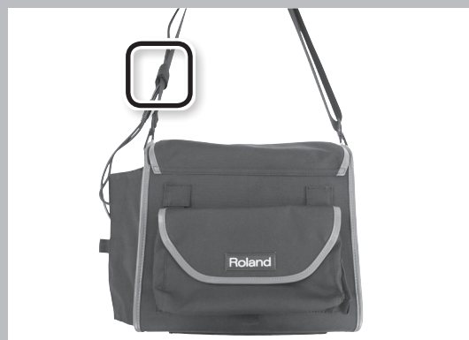
ケースの側面には、ケーブル通しのフラップを装備しています。