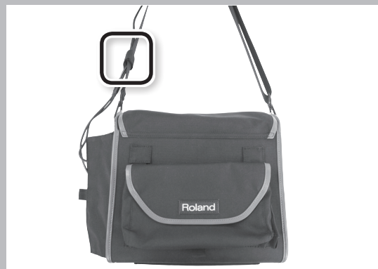
The side of the carrying case has a flap for running cables through.