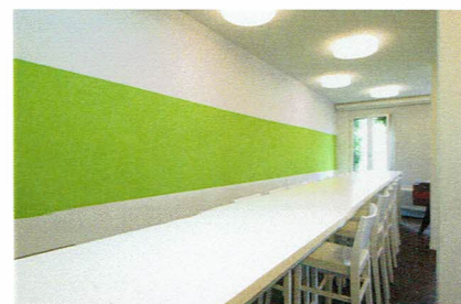
Fugenlose akustische Wandbekleidung